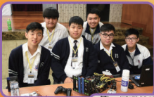
第8屆第一屆聯校機器人格鬥大賽 1st Inter-school robot fight competition